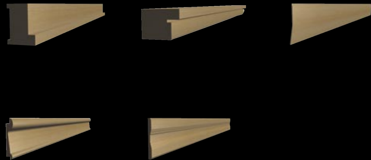
Mit Dekorfolie ummantelte Leisten