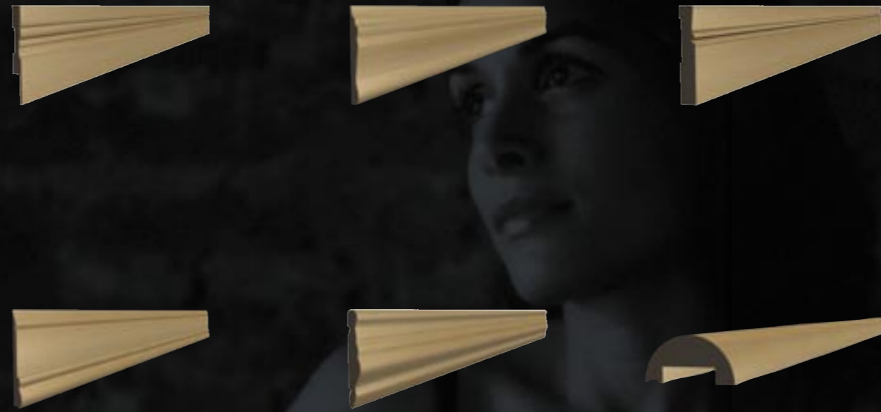
Mit Echtholz furnier ummantelte Leisten