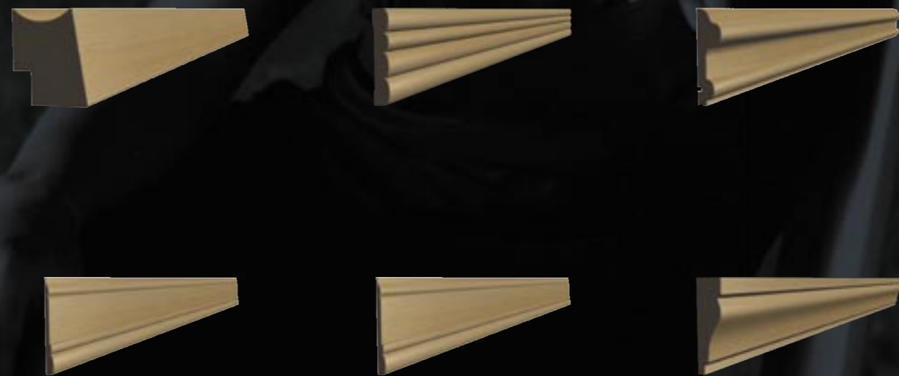
Massivholzleisten - aus unterschiedlichen Holzarten